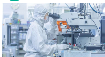
▲防じん服を着てクリーンルーム内で働く人

クリーンルームというとてもきれいな部屋で作られています。目に見えないくらい小さなほこりも持ち込まないように、てつて的に管理されています。温度や湿度も調整されていて、中で働く人は防じん服という専用の服を着て、けんび鏡を使って作業します。