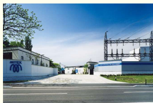
▲尾花沢事業所の入り口

現代の生活にはさまざまな電化製品が欠かせません。私たちは、そのたくさんある便利な製品の働きを正確にコントロールするために使われる、半導体という部品を作っています。また、新しい製品にぴったり合うように新しい半導体の開発も行っています。皆さんが快適に楽しい生活ができるように支えるお仕事です。